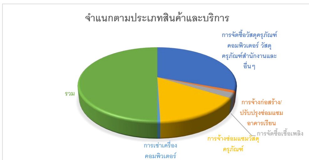
แผนภูมิที่2 แสดงมูลค่าการจัดซื้อจัดจ้าง จำแนกตามประเภทสินค้าและบริการ

จากตารางที่2 จะเห็นได้ว่างบประมาณในภาพรวมที่ใช้ในการจัดซื้อจัดจ้างของโรงเรียนนายอำเภอฟิตยาคมจำนวน 4,178,868.89 บาท ที่มีมูลค่าการจัดซื้อจัดจ้างมากที่สุด 3 ลำดับแรกคือ การจัดซื้อวัสดุครุภัณฑ์คอมพิวเตอร์ วัสดุครุภัณฑ์สำนักงานและอื่นๆ จำนวน 2,678,396.89 บาท คิดเป็นร้อยละ 64.09 รองลงมาคือการจ้างซ่อมแซมวัสดุครุภัณฑ์ จำนวน 530,992.00 คิดเป็นร้อยละ 12.72 และผลการเช่าเครื่องคอมพิวเตอร์จำนวน 526,450.00 บาท คิดเป็นร้อยละ 12.59